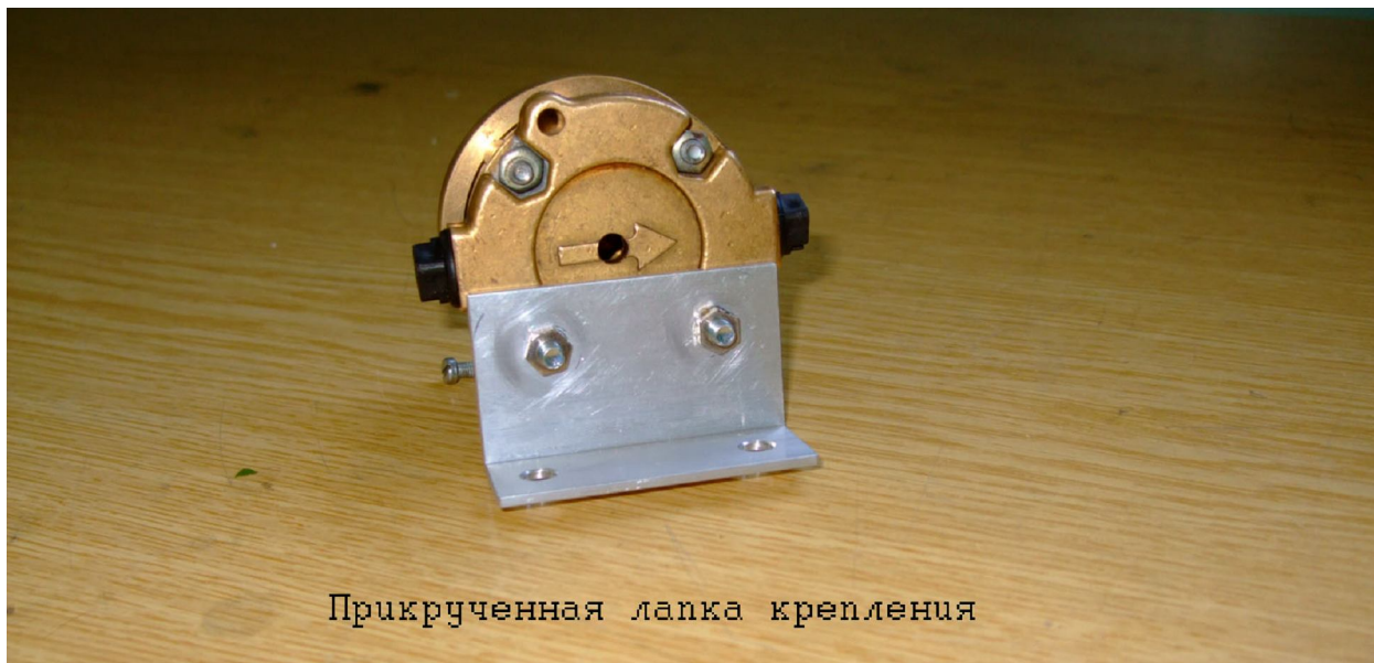
Прикрученная лапка крепления

5. Винтами, выкрученными из расходомера закрепить крышку, не забыв про уплотнительное кольцо.